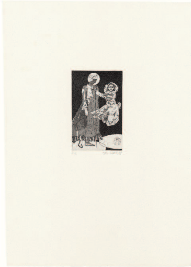
BILDHAUEREI ELKE HÄRTEL: „NIMM, LIES“, 2018 AQUATINTA-RADIERUNG AUF ZERKALL, ALT MEISSEN 270 G, 42 x 29,7 CM, DRUCK: MELISSA MAYER GALBRAITH, MÜNCHEN