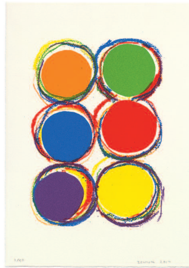
GLASMALEREI JERRY ZENIUK: O. T. 2017

C-PRINT AUF KODAK PREMIER, COLLAGIERT AUF FINNPAPPE 850 G, 35,2 x 30,8 x 0,15 CM, ABZUG: FACHCOLOR BÜHLER, FREIBURG/BR.