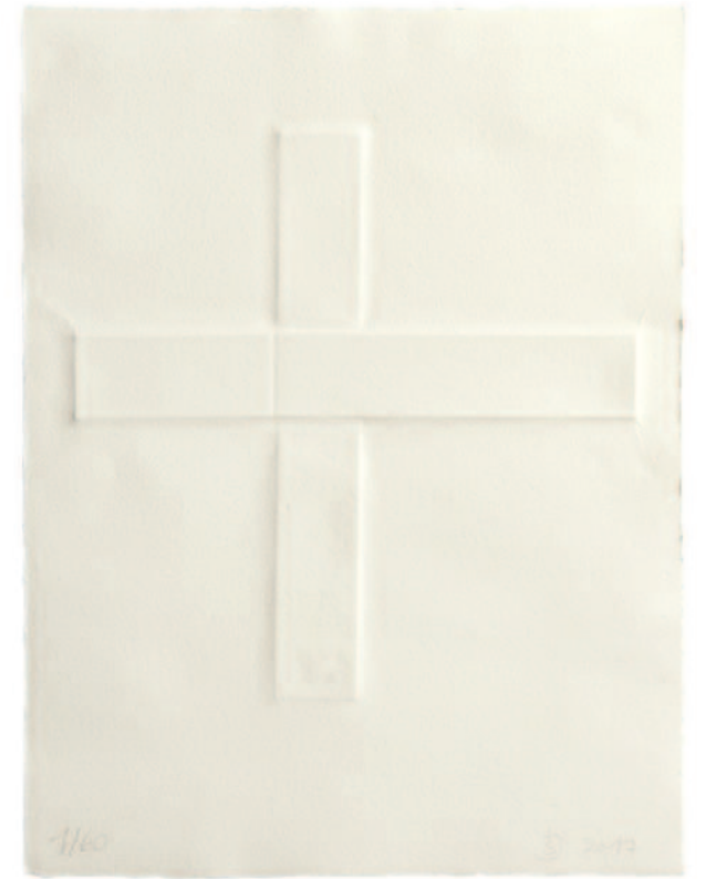
VASA SACRA JULIANE SCHÖLSS: O. T. 2017 PRÄGEDRUCK AUF HAHNEMÜHLE, ECHT-BÜTTEN 350 G, 42 x 32,5 CM, DRUCK: JULIANE SCHÖLSS, MICHAEL SCHÖLSS, JOCHEN HANNEMANN, INGOLSTADT